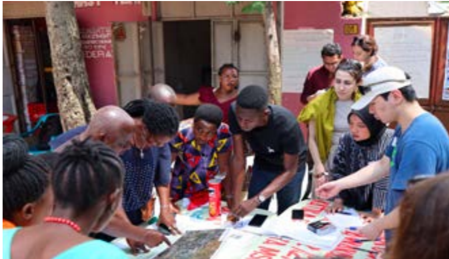
Kielelezo cha 7: Majadiliano ya Kikundi yaliyofanyika Gedeli, Mwanza, Tanzania, 2023.

Hii ina maana kwamba pamoja na mpango uliopo wa upanuzi wa SSS wa MWAUWASA, ni muhimu pia kuchunguza jinsi MCSFF inavyoweza kufadhili miradi ambayo imeandaliwa kulingana na mahitaji ya eneo husika na inayoendeshwa chini ya uangalizi wa jamii ili kutoa masuluhisho yanakidhi mahitaji na endelevu ya usafi wa mazingira [29].