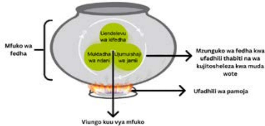
Kielelezo cha 2: Mahitaji muhimu kwa mfuko wa akiba endelevu ufanikiwe

Upanuzi wa SSS unahitaji vyoo vilivyoborehwa ili kuunganishwa kwenye mfumo.