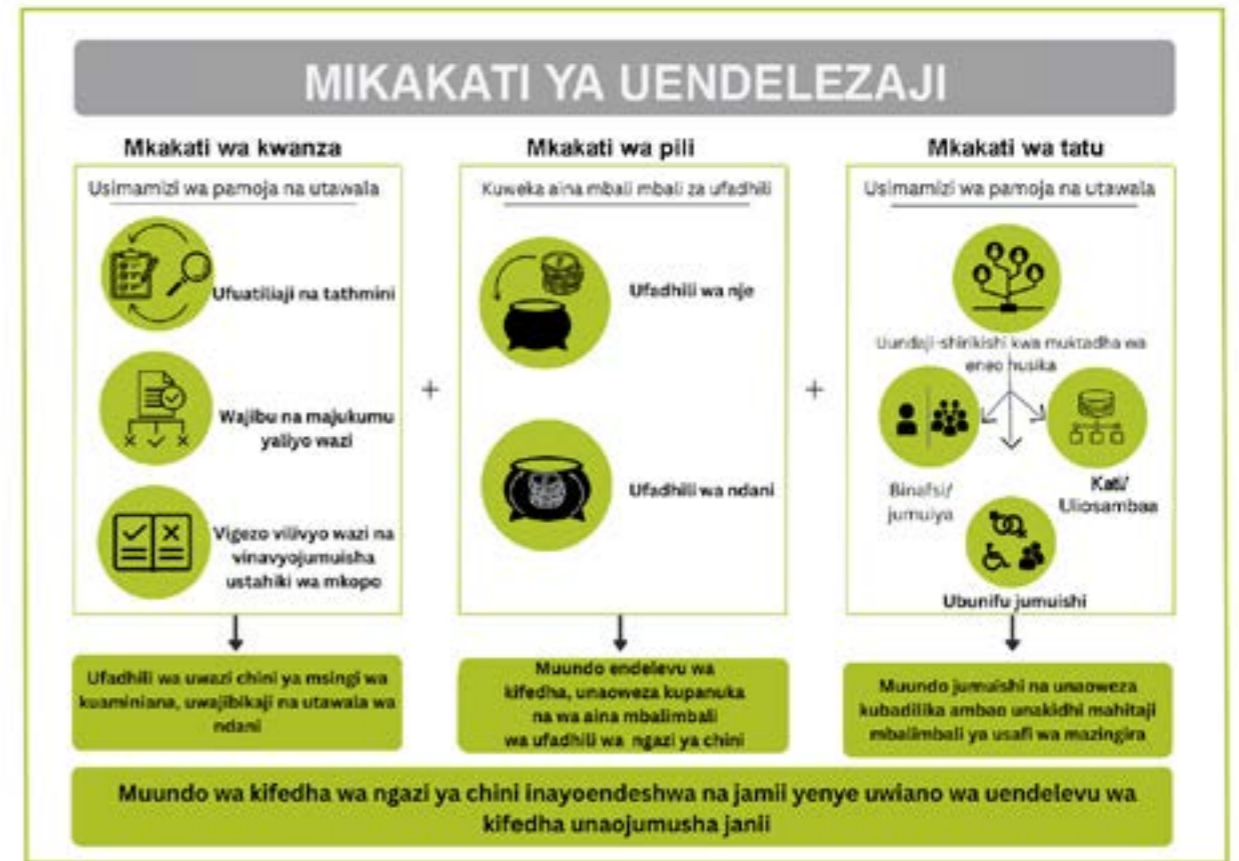
Kielelezo cha 4: Mikakati ya kuwezesha chungu kuendelea kupika (Mfuko wa akiba kuendelea kukua)

(JENGA) ambao unatoa mikopo kwa ajili ya miradi mbalimbali ya maendeleo kama vile ununuzi wa ardhi, ujenzi wa nyumba, shughuli za kujiongezea kipato na uendelezaji wa miundombinu. Hata hivyo, akiba ya mfuko wa Jenga haitumiki mara kwa mara kwa miradi ya vyoo na usafi wa mazingira. utafiti [17] unaonyesha kuwa kuna changamoto za ulipaji, haswa kwa miradi isiyoingiza mapato.