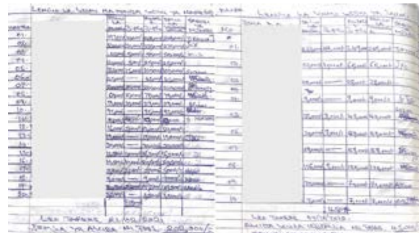
Kielelezo cha 5: Mfano wa kitabu cha kumbukumbu za Akiba kikundi cha Tujituma, Mwanza, Tanzania, 2023.

Kulingana na mifano iliyotajwa hapo juu, tunaamini kuwa fedha zinazoongozwa na wanajamii hazizewezi kufanikiwa bila uaminifu na uwajibikaji, na ambazo zinategemea kwa kiasi fulani usimamizi na utawala dhabiti. Kwa usimamizi shirikishi, tunamaanisha kugawana majukumu na uwajibikaji ili vikundi kama hivi viweze kuepuka mienendo mibaya ya viongozi na kuimasha uhusiano miongoni mwawanakikundi na kuaminiana [19]. Vikundi vinapaswa kuhakikisha kuwa wanachama wanakubaliana kwa pamoja kuhusu mifumo iliyopo na kuwajibishana linapokuja suala la kufuata itifaki [20, 21]. Kwa kutoa nafasi ya kutoa maoni yao na kufanya maamuzi ya pamoja, Mifuko ya kijamii kama vile MCSFF