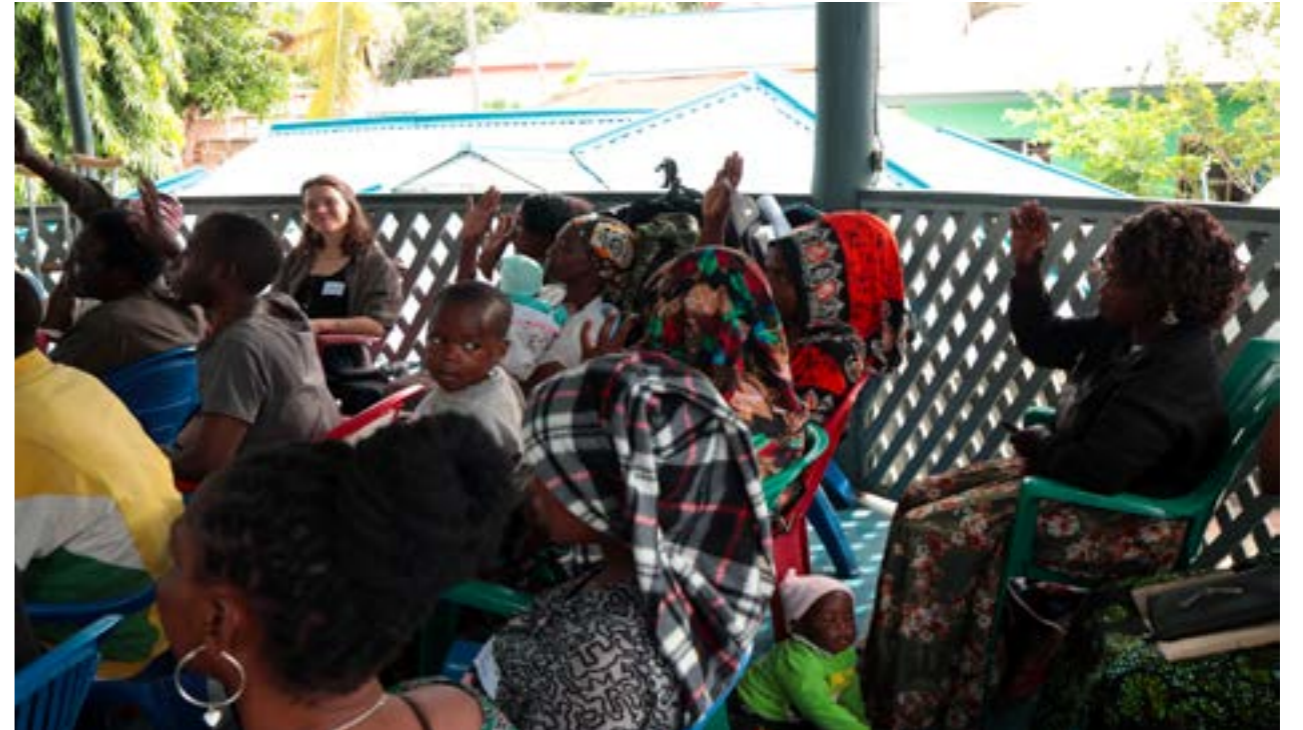
Kielelezo cha 8: Warsha ya Utayarishaji wa pamoja iliyoifanyika Mabatini, Mwanza, 2023.

Hatimaye, jalada la chaguzi lazima pia lijumuishe uelewa wa maono ya muda mrefu ya kupanga kwa ajili ya makazi ili kupunguza hatari zinazoweza kutokea, kama vile zinazohusishwa na mabadiliko ya hali ya hewa na majanga ya asili, na pia kukabiliana na mahitaji ya jamii ya siku zijazo [4]. Kwa sababu hizi, ushirikiano mkubwa kati ya jamii, serikali ya mtaa, na mamlaka ya maji unahitajika ili kuhakikisha kwamba jalada la chaguzi linaunga mkono maono ya muda mrefu ya jiji kwa ufanisi.