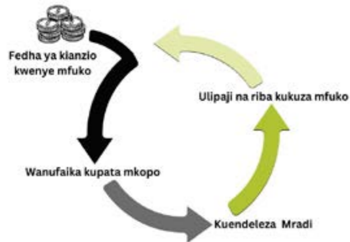
Kielelezo cha 3: Mfuko wa akiba unaozunguka, kama suruhisho la changamoto za kifedha

Kuwa wanachama wa Federation kunawawezesha Jamii watu maskini Mwanza kupata Mfuko wa akiba maendeleo