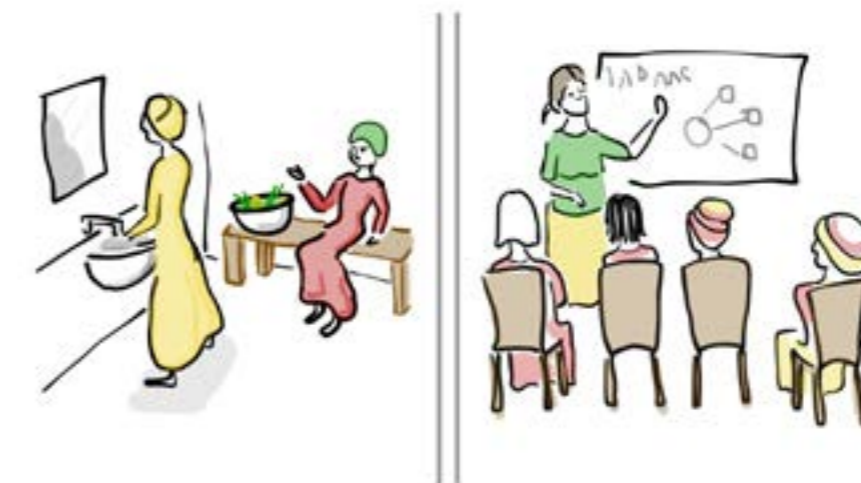
Kielelezo cha 4: Kitovu cha Uangalizi. Kimeundwa kusaidia jumuiya kupata mahali pa mikutano na Kupata huduma bora usafi wa mazingira, imeonyeshwa hapo juu. Wanawake wanaweza kutumia muda wao wenyewe wanapotumia huduma ya choo ambacho ni safi na pia wanaweza kushiriki katika matukio ya elimu au vikao vya jumuiya katika Kituo cha cha Jumuiya. Kielelezo: Calle, D., 2023.

MWAUWASA na wakazi wanaweza kunu-faika na hali ya kiuchumi kwa kuokoa gharama za uwekezaji kuunganisha miundombinu ya maji kwa makundi ya kaya kwa pamoja ambazo zingetumika kwa kuunganisha kila nyumba kivyake. Matokeo yake, zaidi rasilimali zinaweza kuelekezwa katika utunzaji na uboreshaji wa huduma.