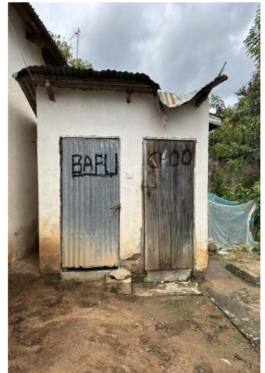
Mchoro wa 2: Choo cha Jumuia cha binasi chenye sehemu za kuogea na huduma ya kujisaidia Kigoto, Mwanza, 2023.

Kwa sababu ya uhaba wa rasilimali na ukomo wa muda, ukubwa wa sampuli ya washiriki katika matembezi ndani ya mtaa, mahojiano, na mijadala ya vikundi lengwa ulikuwa mdogo, na uwezekano wa kuathiri uwakilishi wa matokeo. Kwa hivyo, tahadhari inapaswa kuchukuliwa wakati wa kujumuisha matokeo zaidi ya muktadha maalum wa masuluhisho utofauti wa lugha na tamaduni kati ya watafiti na washiriki pia vilileta changamoto katika kuelewa kikamilifu na kutafsiri majibu. Changamoto hizi zinaangazia hitaji kubwa la utafiti na mitazamo mipana zaidi ili kuimarisha uhalali na utekelezaji wa mipango na sera siku zijazo.