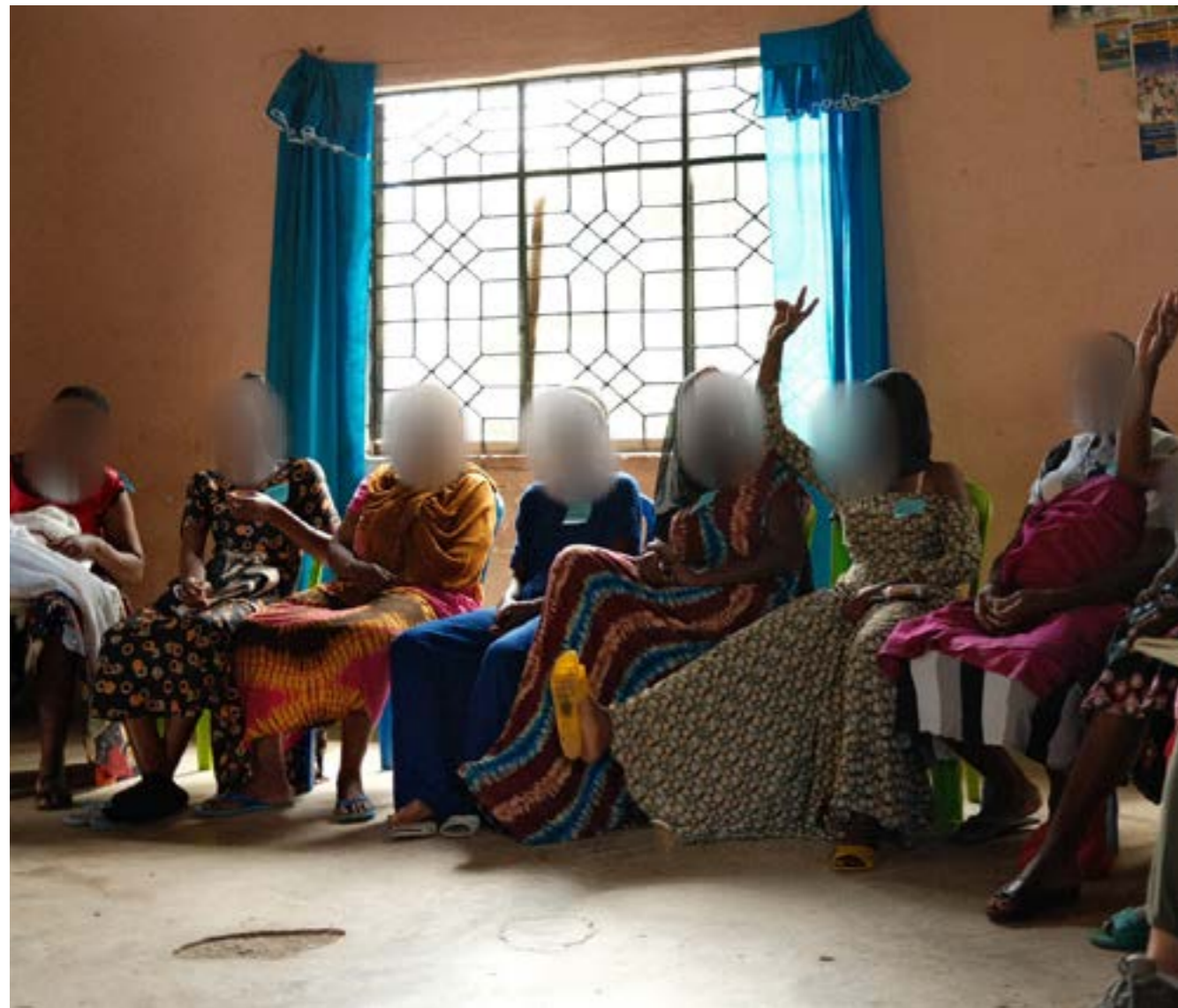
Kielelezo cha 1: Wanawake wanaoshiriki katika mijadala ya warsha mtaa wa Kigoto, Mwanza, 2023.

kijamii kijamii ilivyogawa majukumu yasiyobadilika kulingana jinsia yanayoelekeza mgawanyo huu wa kazi na malezi katika ngazi ya familia (OVERDUE, 2022; Van Aelst, 2014; Feinstein, et al., 2010). Kama inavyoonekana katika Lengo la Umoja wa Mataifa la Maendeleo Endelevu la 5.4, mzigo usio na usawa unaowekwa kwa wanawake kuhusiana na muda usi-olipwa, kazi na matunzo ni suala muhimu linalokubaliwa katika ngazi ya kimataifa; hata hivyo, bado kuna hitaji la dharura la kutambua kazi ya matunzo au malezi isiyu na malipo katika juhudi za kushughulikia kukosekana kwa usawa wa kijinsia (UN, 2015). Muhtasari huu wa sera unatumika kama nyenzo ya kujenga upya na kufikiria upya sera jumuishi inayoshughulikia mwitikio wa kijinsia, ikichochea na sauti zenye ari za wanawake katika makazi ya Kigoto. Matokeo yaliyoainishwa katika muhtasari huu yanalenga kutoa ujuzi muhimu na mapendekezo yanayotekelezeka na kutumika kama sehemu ndogo kwa suala kubwa la usawa na maendeleo endelevu.