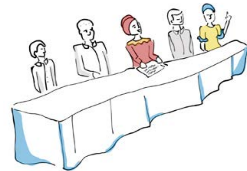
Kielelezo cha 6: Rasilimali na Sauti za Wanawake. Katika kusahihisha na kufasiri upya kanuni na miongozo ya kijamii, kufanya maamuzi lazima kujumuishwe wanajamii, haswa wanawake na walezi. Kielelezo: Calle, D., 2023.

• Msaada na mafunzo lazima yatolewe kwa vikundi vya kuweka akiba ili kuwawezesha